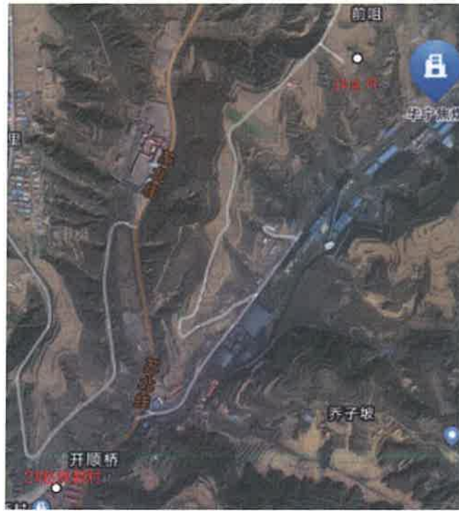
图 1 地下水崖坪村 1#、赵院新村 2#监测点位示意图